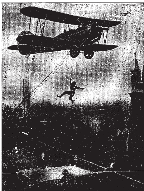
Abb. 7.: Szene aus dem Training der fliegenden Reporter.

Auch die Bild- und Nachrichten-Uebermittlungsstellen des In- und Auslandes stehen gegenwärtig in einer umfangreichen Organisationsarbeit, um die Berichterstattung über die Olympischen Spiele in Berlin in jeder Weise sicherzustellen. Um eine schnelle Uebermittlung der Bilder durchzuführen, werden Sonder-Reporter ausgebildet, die aus den [sic!] fliegenden Flugzeug über den großen Zeitungshäusern abspringen und so das neueste Bildmaterial abliefern. Unser Bild zeigt einen der fliegenden Reporter während der Ausbildung; er hat die Strickleiter verfehlt, wird aber von dem aufgespannten Sprungtuch aufgefangen.“ 11