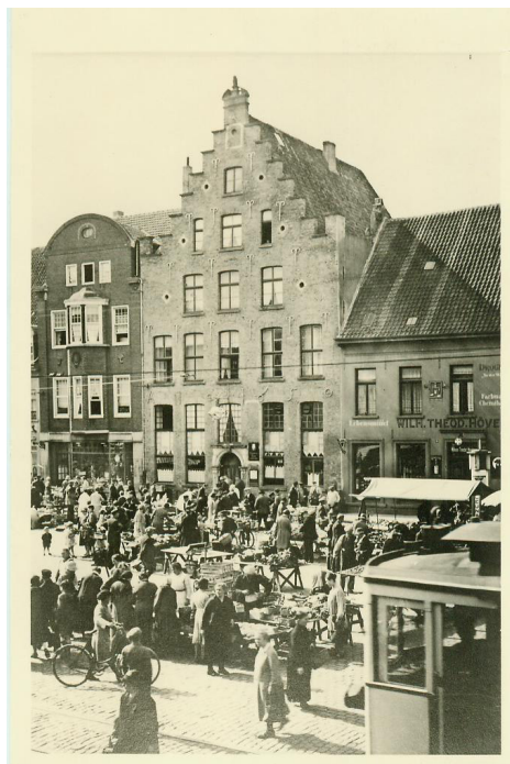
Abb. 2.: Der Hof von Holland, 1920.