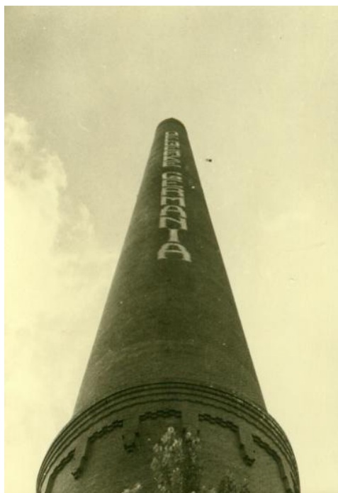
Abb. 1.: Schornstein der Germania-Ölwerke.