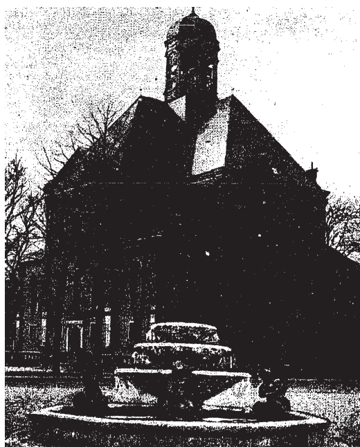
Abb. 3: Abgedruckter Entwurf des Märchenbrunnens.