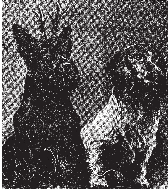
Abb. 6: Die neu gezüchteten Hunderassen.